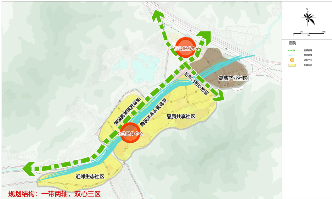
规划结构图 ◆ 01

YUYAOSHI DAYINZHEN ZHENQU BIANZHIDANYUAN KONGZHIXINGXIANGXIGUIHUAXIUBIAN