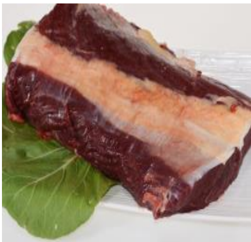
可现杀黄牛肉 70 元/斤