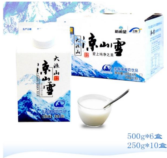
凉山雪 (小雪 250 克*10 盒装) 单价 60 元