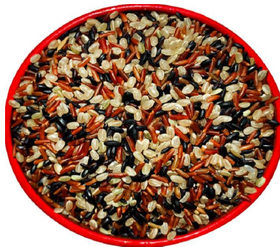
大凉山三色糙米 2 斤装 单价 30 元