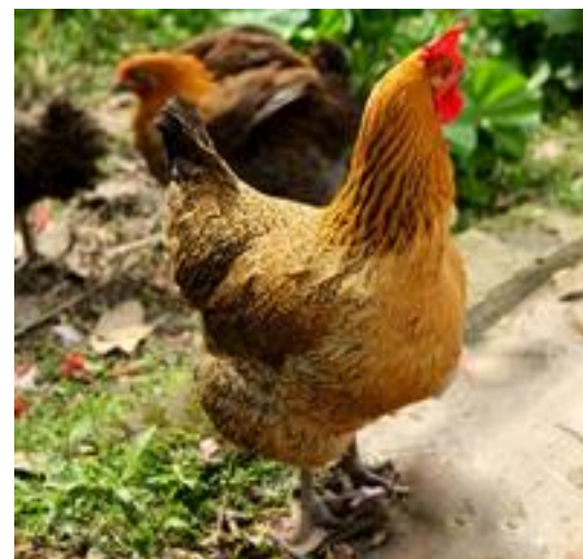
彝家放养土母鸡(净重 4.5 至 5 斤) 240 元/5 斤