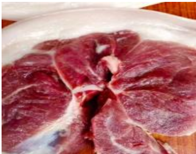
农家生态猪肉 115 元/3 斤