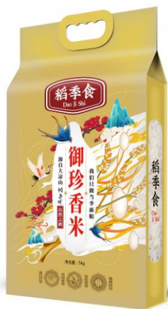
5kg /109 元