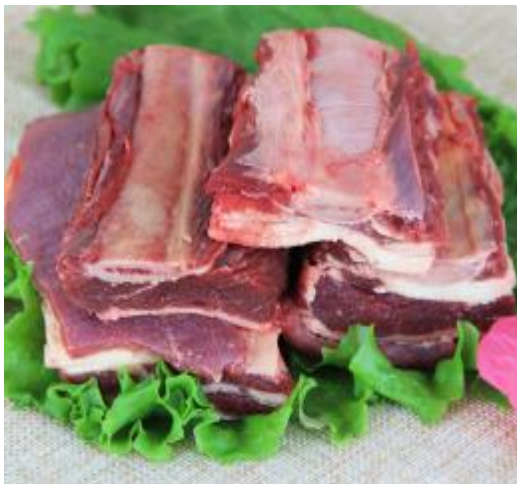
高山放养牦牛肉 牦牛排骨 248 元/3 斤