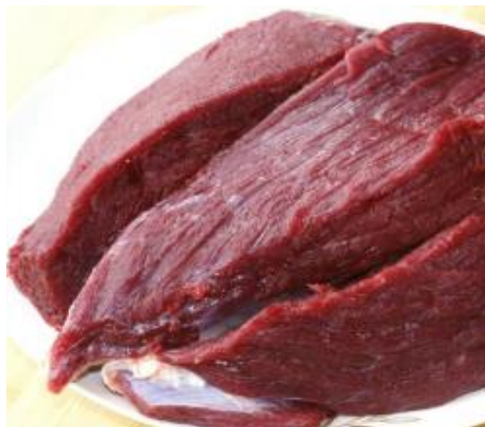
高山放养牦牛肉 278 元/3 斤