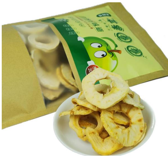
苹果片 100 克袋装 单价 15 元