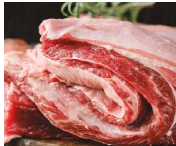
牦牛牛腩肉 264 元/3 斤