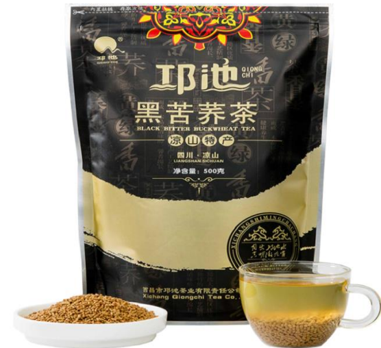
邛池黑苦荞茶 500 克袋装 单价 25 元