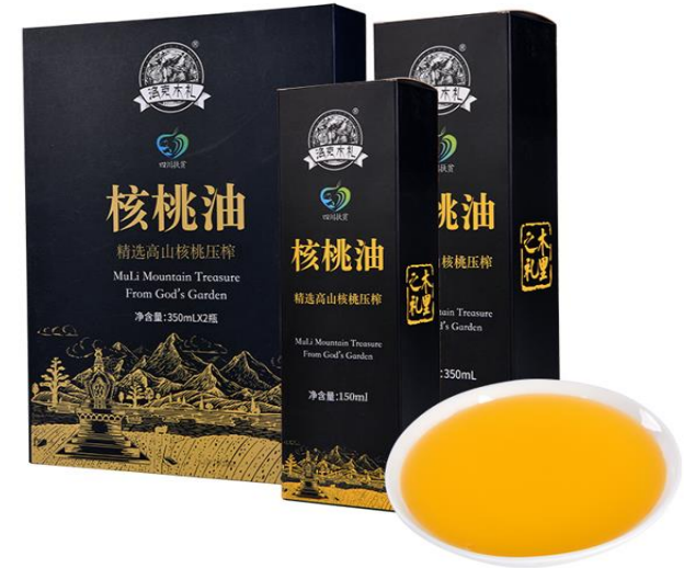
核桃油 150 毫升 单价 45 元 350 毫升 单价 68 元 350 毫升*2 毫升双瓶礼盒装单价 190 元