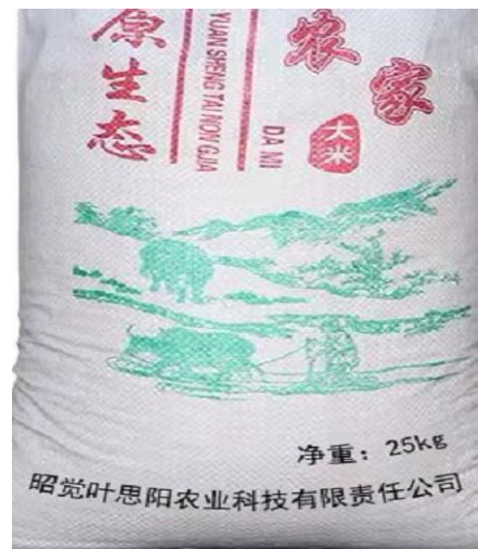
大米 25Kg/145 元 包装还在设计中