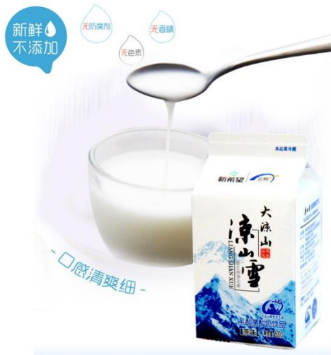
凉山雪 (大雪 500 克*6 盒装) 单价 60 元